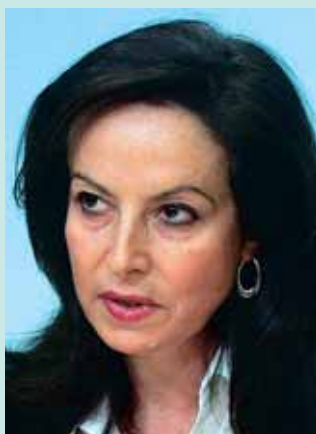
Η Υπουργός Παιδείας κα Διαμαντοπούλου που προτρέπει τα ΤΕΙ να ασχοληθούν με τη ζαχαροπλαστική και τη σοκολάτα (Σύνοδος Προέδρων ΤΕΙ 2-4/12/2009)

Σίγουρα η λύση δεν βρίσκεται σ' αυτό που έγινε στις 18 Δεκέμβρη έξω από το υπουργείο Παιδείας. Μια συγκέντρωση παρωδία 100 ανθρώπων.