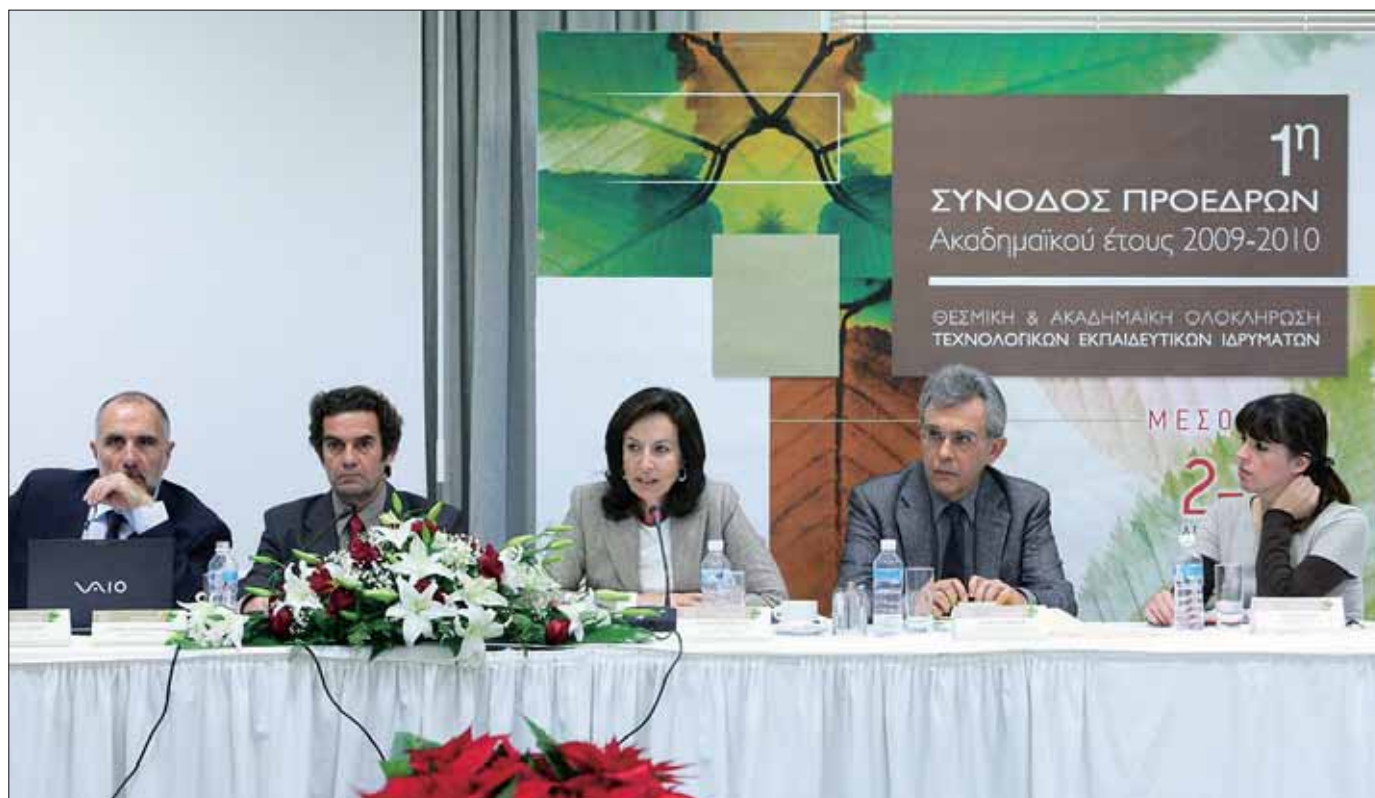
Από αριστερά: Ιωάννης Πανάρετος (Υφυπουργός Παιδείας), Βαγγέλης Πολίτης (Πρόεδρος Τ.Ε.Ι Μεσολογγίου), Άννα Διαμαντοπούλου (Υπουργό Παιδείας), Βασίλης Παπάζογλου (Ειδικός Γραμματέας Ανώτατης Εκπαίδευσης), Ιφιγένεια Ορφανού (Ειδική Γραμματέας Ενιαίου Διοικητικού Τομέα Διαχείρισης Προγραμμάτων Κ.Π.Σ)

βαλλοντολογικά θέματα, Δημόσια έργα, κλπ. Προτίθεται δε στο άμεσο προσεχές μέλλον να δημιουργήσει Ινστιτούτο με σκοπό την κάλυψη των αναγκών σε περαιτέρω εκπαίδευση, επιμόρφωση και δια βίου μάθηση των δημοσίων υπαλλήλων Μηχανικών ΤΕΙ και στον τομέα αυτό εκτιμούμε ότι υπάρχει η δυνατότητα στενής συνεργασίας με τα Τεχνολογικά Εκπαιδευτικά Ιδρύματα και προσβλέπουμε σ' αυτήν.