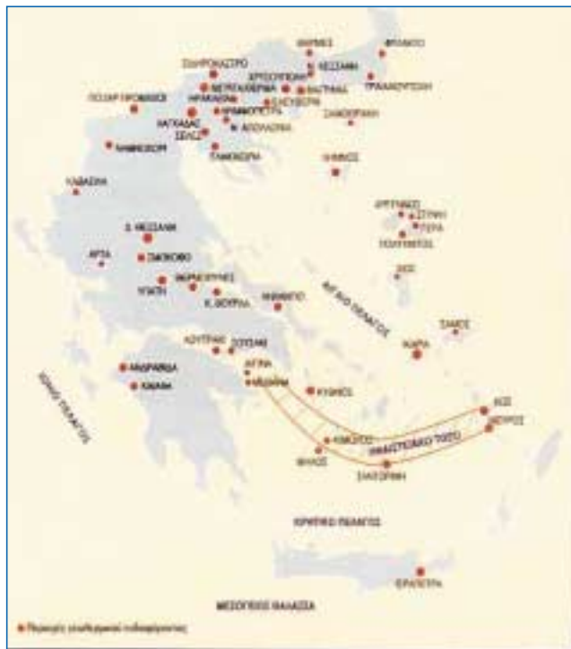
Οι κυριότερες περιοχές γεωθερμικού ενδιαφέροντος στην Ελλάδα

Στον τομέα των ακινήτων, το κόστος της αγοράς των οικοπέδων (>% 300/τ.μ.) και των κατοικιών (>% 1.550/τ.μ.) στην Αττική έχει αγγίξει τα ανώτερα όρια ανοχής της Ελληνικής Αγοράς Ακινήτων, καθιστώντας τα περισσότερα διαμερίσματα και μονοκατοικίες (π.χ. μεζονέτες), πολυτελείς κατασκευές, όχι όμως βάσει των προδιαγραφών τους, αλλά κυρίως βάσει των ζητούμενων τιμών.